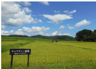
2016年秋収穫前の水田

今年度もチャリティー農園で農家さんの指導のもと田植え体験をしていただきます。田植え体験後は地元のお母さんたちが作ってくださるおにぎりとお味噌汁の昼食をご用意しています。また水田見学は完全予約制で午前・午後の2回用意しています。まだご自身の水田をみていらつしやらない方は是非ご参加ください。