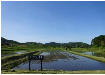
2017年春のイベント水田

今年度もチャリティー農園で農家さんの指導のもと田植え体験をしていただきます。田植え体験後は地元のお母さんたちが作ってくださるおにぎりとお味噌汁の昼食をご用意しています。水田見学は完全予約制で午前・午後の2回用意しています。